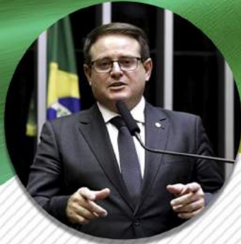
CONGRESSISTA RONALDO SANTINI Deputado Federal PTB/RS

IMPERDÍVEL – PROGRAMA RODA DA VIDA #5 – 19.05.20.