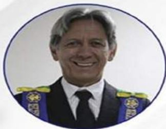
ARQUIARIANO BITES SEC. GERAL DE ENTIDADES PARAMAÇONICAS