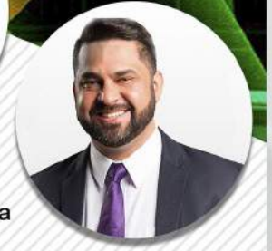
ELIZEU KADESH Secretário Geral Adjunto de Educação e Cultura