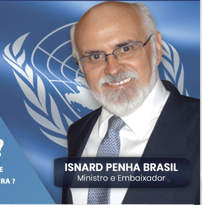
ISNARD PENHA BRASIL Ministro e Embaixador

QUAIS SÃO AS CONSEQUÊNCIAS DA POLÍTICA DE RELAÇÕES EXTERIORES NA ECONOMIA BRASILEIRA ?