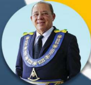
MÚCIO BONIFÁCIO GRÃO-MESTRE GERAL