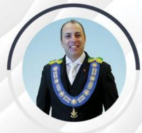
Arlindo Chapetta Secretário-Geral de Comunicação e Informática

Os Rumos do Brasil e a História da Constituinte.